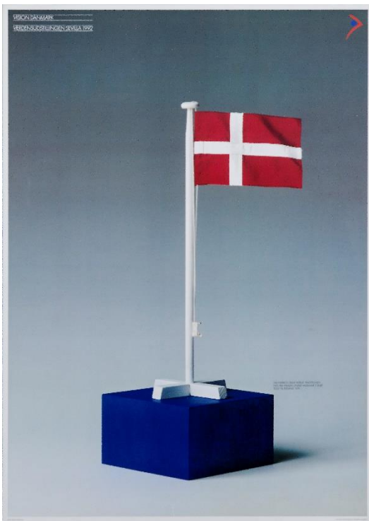
Plakat af Per Arnoldi, 1992

Hvorfor/hvorfor ikke? Er det i nogle sammenhænge?