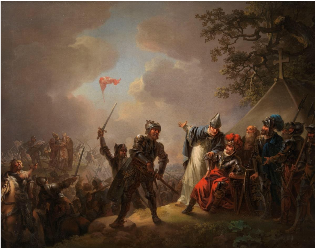
Maleri af C. A. Lorenzen, 1809

Åben i perioden 26. januar – 12. august 2019